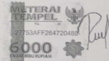
Rio Okrifano Fadilah