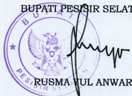
RUSMA YUL ANWAR