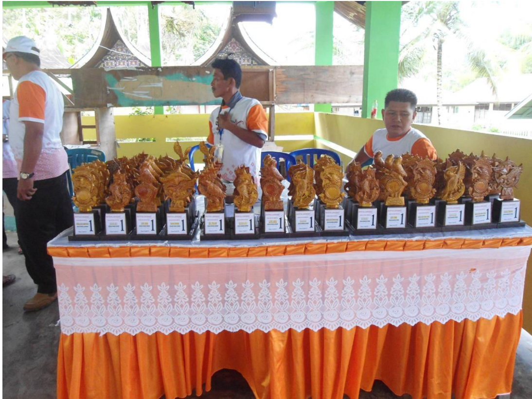
TROPY 19 SET UNTUK 5 KELAS LOMBA