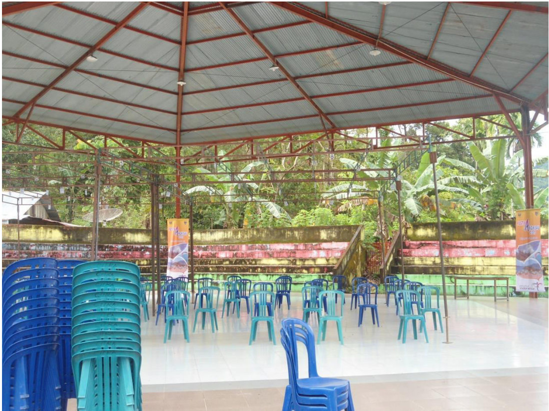
PERSIAPAN TENDA GANTANGAN BURUNG, KURSI DAN MEJA