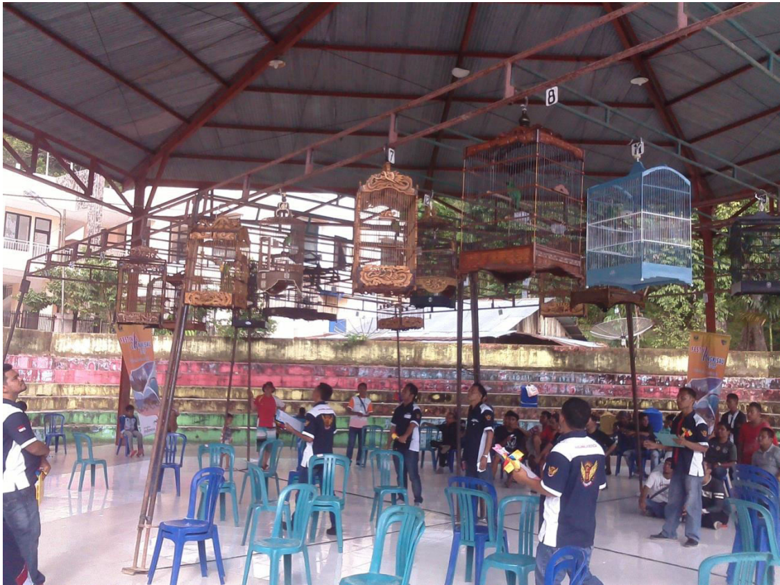
KELAS PESONA INDONESIA JENIS BURUNG CUCAK HIJAU POLOS 28 GANTANGAN