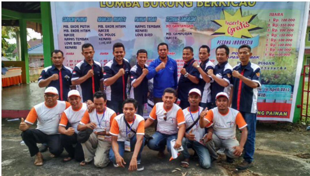
PENUTUPAN YANG DIHADIRI OLEH KEPALA DINAS PARIWISATA PEMUDA DAN OLAHRAHA KABUPATEN PESISIR SELATAN, DEWAN JURI RAJAWALI INDONESIA DAN PANITIA PELAKSANA