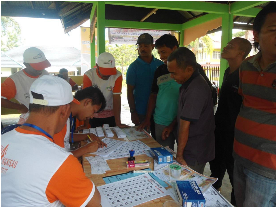
PENDAFTARAN PESERTA LOMBA DAN PEMBELIAN INSERT