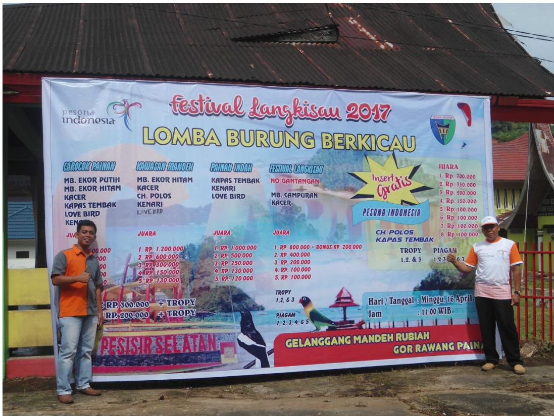
KELAS YANG DILOMBAKAN