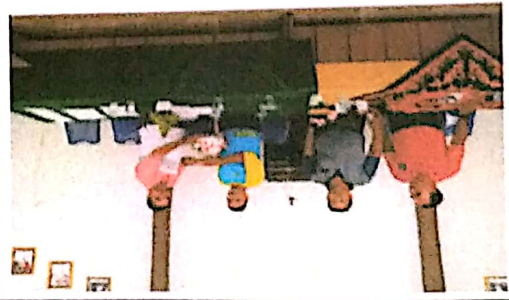
Program : Pmbinaan dan Pemasarakatan Olahraga

Kegiatan : Aktivasi dan Bantuan Club Olahraga